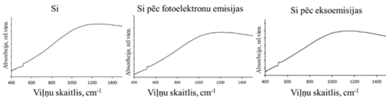
2.att.: FTIR spektri: Si, Si pēc fotoelektronu emisijas un Si pēc eksoemisijas

Turpināti mikrotriodes satelītparaugu nanoslāņu \text{SiO}_2 , \text{Si}_3\text{N}_4 , Si un turpināti W, \text{WB}_2 nanoslāņu virsmas morfoloģijas mērījumi, izmantojot atomspēku mikroskopiju (AFM).