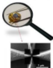
Sadarbībā industrija & zinātne top inovatīvas struktūras...

Inovatīvas mikrotriodes struktūras radīšana audioelektronikas pastiprinātājiem